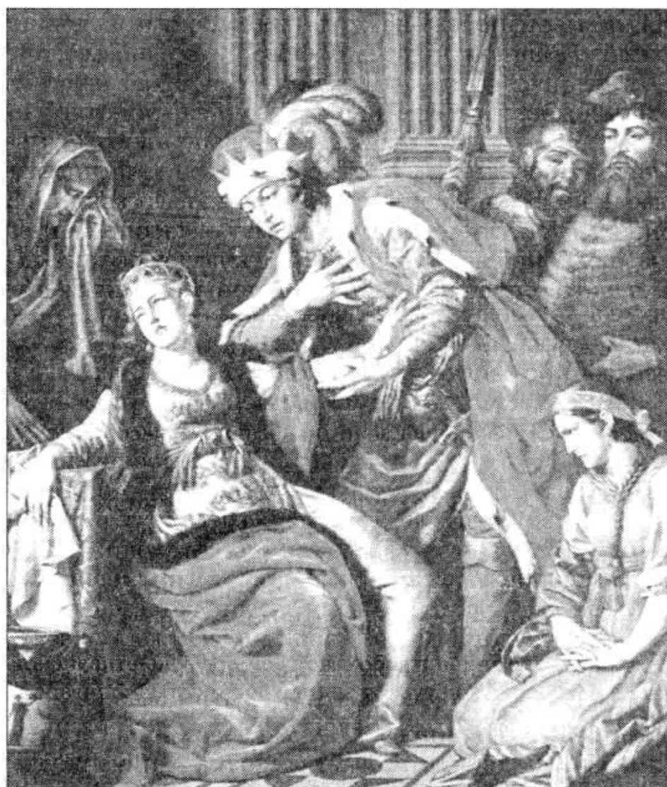
Рис. 12. А. Лосенко. Встреча Владимира и Рогнеды