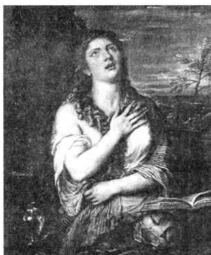
Рис. 8. Тициан. Кающаяся Мария Магдалена

Задание для работы в парах. Один из партнеров изображает на лице какую-либо эмоцию (“живая скульптура”), а второй пытается ее угадать и при этом описывает выражение лица своего партнера. В случае неправильного ответа угадывающий, как скульптор, вносит изменения, предлагая партнеру изменить положение каких-либо частей лица в соответствии со своим представлением о названной эмоции, и вновь описывает лицо. Затем партнеры меняются ролями.