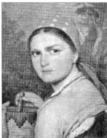
Рис. 5. А. Венецианов. Девушка с берестяным коробом

Задание. Рассмотрите портреты (рис. 5–8). По выражению лиц определите настроение и характер изображенных людей.