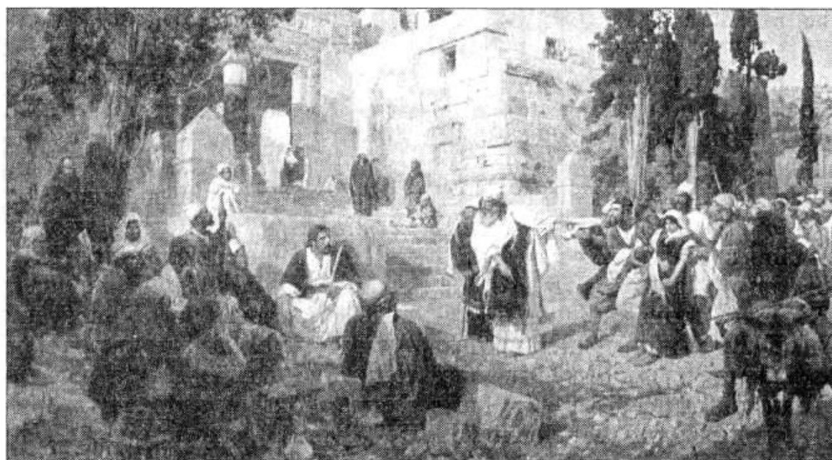
Рис. 11. В. Поленов. Христос и грешница