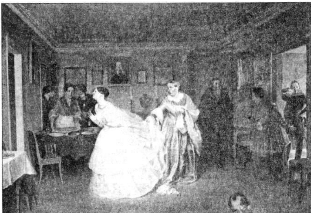
Рис. 9. П. Федотов. Сватовство майора